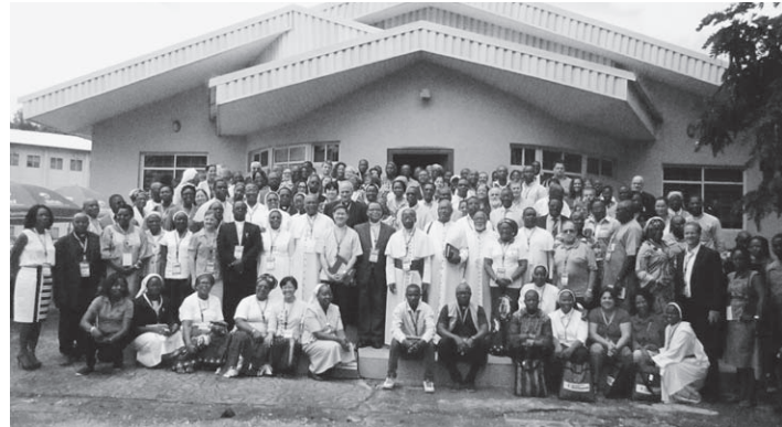
Gruppenbild: TeilnehmerInnen der COATNET-Konferenz in Abuja.