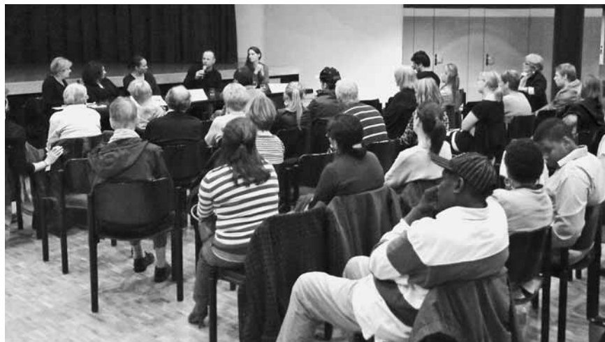
ExpertInnenrunde nach der Ausstrahlung von «Anna in Switzerland».

Eine interessante Veranstaltung im Rahmen der Aktionswoche «Die Schweiz gegen Menschenhandel» haben wir gemeinsam mit der Pfarrei Liebfrauen in Zürich organisiert. Viele Interessierte nahmen an der Ausstrahlung des Films «Anna in Switzerland» mit anschliessender ExpertenInnenrunde teil. Im Film erzählt Anna ihre Geschichte, wie sie von Menschenhändlern in die Schweiz verkauft wurde, wie sie überleben und entkommen konnte und vor allem, wie sie ihre Vergangenheit Stück um Stück zu bewältigen lernte. Nach dem Film beantworteten Expertinnen und Experten Publikumsfragen rund um die Themen Frauenhandel in der Schweiz, Traumatisierung und Opferstigmatisierung.