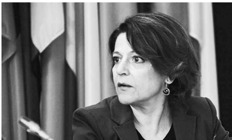
OSZE Special Representative Maria Grazia Giammarinaro an der Konferenz in Wien.

Die FIZ engagiert sich innerhalb des Kooperationsprogramms zwischen der Schweiz und Rumänien im Projekt PIP (Prevention, Identification, Protection) gegen Menschenhandel (wir haben im Mai-Rundbrief darüber berichtet). Zu den Themen Identifizierung und Opferschutz (Identification, Protection) fanden in Rumänien und der Schweiz mehrere Arbeitssitzungen mit staatlichen und nicht staatlichen Vertretern beider Länder statt. Im September wirkten ausserdem eine FIZ-Mitarbeiterin und ein KSMM-Vertreter als Experten an einem Workshop der rumänischen National Agency Against Trafficking in Persons (ANITP) zum Thema Prävention mit. Die Teilnehmenden waren sich einig, dass es bei der Prävention nicht darum geht, die Menschen daran zu hindern, dass sie migrieren, sondern zu erreichen, dass sie informiert migrieren. Informiert über ihre Rechte in der Schweiz und über Unterstützungsangebote.